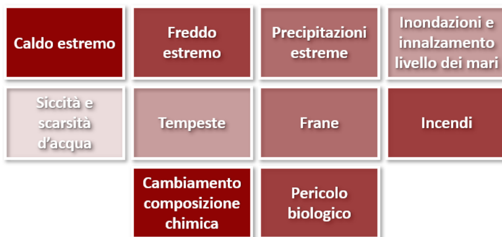
Figura 2 Pericoli climatici oggetto dell'analisi di impatto dei cambiamenti climatici