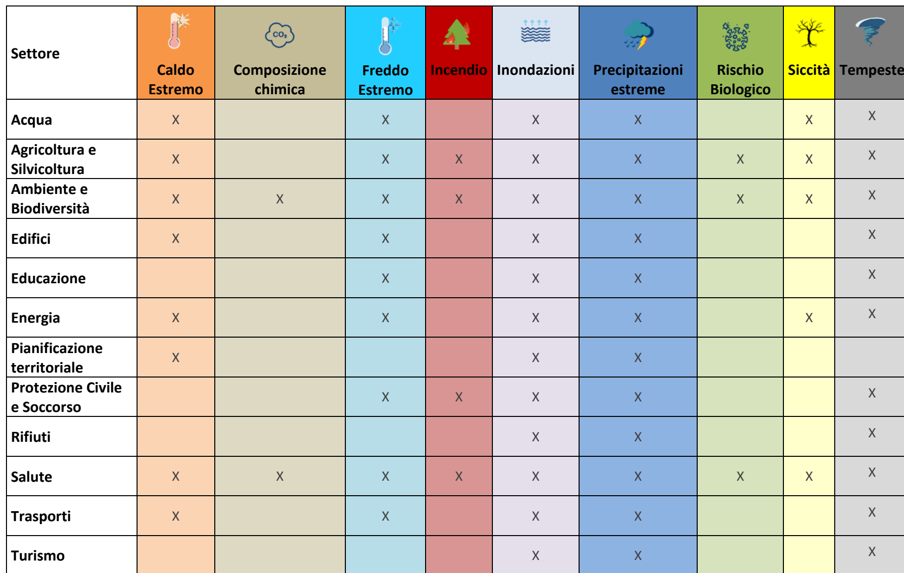
Tabella 3 Matrice Pericoli climatici – Settori impattati